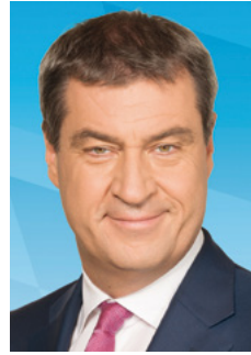
Dr. Markus Söder

Als mittelständische Bank verstehen wir den Mittelstand besonders gut. Und Verständnis ist der erste Schritt für eine ehrliche und kompetente Beratung auf Augenhöhe.