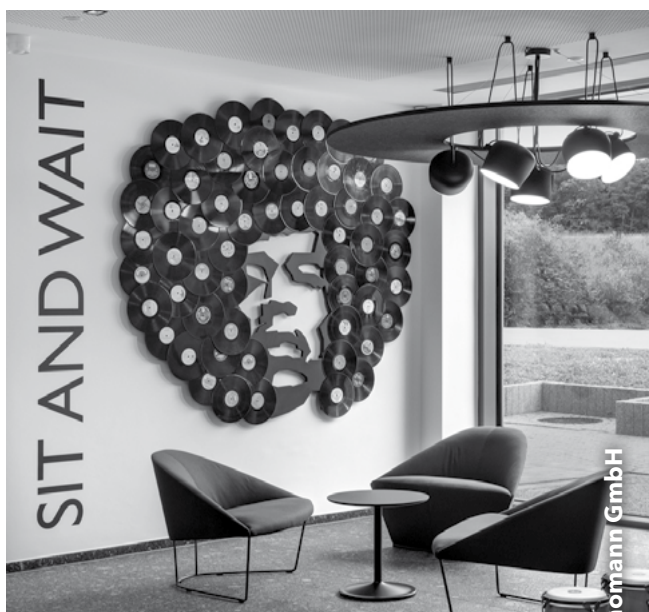
Referenz Thomann GmbH

Das Team von designfunktion wünscht Ihnen ein wundervolles Jahr 2023!