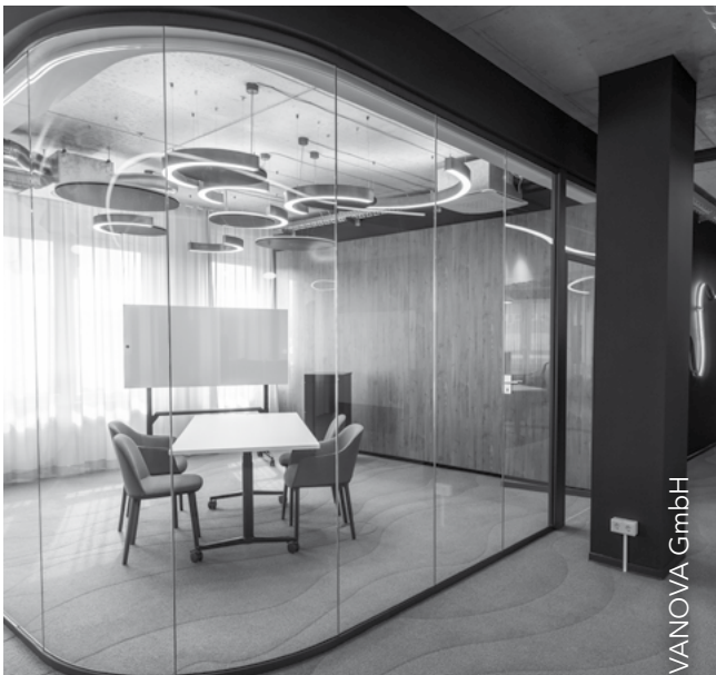
Referenz ADVANOVA GmbH

Das Team von designfunktion wünscht Ihnen ein wundervolles Jahr 2024!