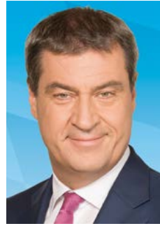
Dr. Markus Söder

Als mittelständische Bank verstehen wir den Mittelstand besonders gut. Und Verständnis ist der erste Schritt für eine ehrliche und kompetente Beratung auf Augenhöhe.